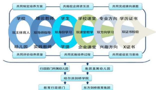
图 1 “双轨并行、三位一体、六共、六双”递进式合作育人新机制

哈尔滨剑桥学院学前教育专业是黑龙江省一流专业, 现已通过教育部师范类专业认证。经过十余年的积累与发展, 专业现已与 260 余所学前教育机构建立合作关系。近年来, 专业与实践基地在培养目标、课程体系、教学团队、实践基地、教学研究及培养质量评价等方面开展全方位深度合作。通过制度化、组织化、规范化的运作, 建立教师培养、培训、研究和服务一体化的合作共同体, 形成了各司其职、资源共享、互惠互利的“双轨并行、三位一体、六共、六双”递进式合作育人新机制, 如图 1 所示。通过四年贯通的实践教学体系, 借助技能实训室、幼儿园模拟室及政府和充足的实习基地等教学条件支持, 学生培养质量持续提高。