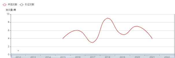
图 2 多元文化素养相关研究总体分析折线示意图

通过计量可视化分析, 从图 2 可以看出, 教师多元文化素养相关研究的数量在过去十年中有所波动, 2018 年达到一定的峰值, 2020 年略为新高, 这表明多元文化素养研究备受学者关注。