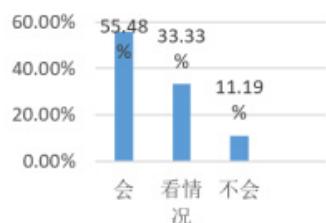
图 1 “如果有关于宣传非物质文化遗产的活动，您会参加吗？”

在“如果有关于宣传非物质文化遗产的活动，您会参加吗？”的问题中，调查情况如图 1 所示。超过一半的大学生表示会参与相关的非物质文化遗产活动，从而得到大部分大学生对保护传承非物质文化遗产的动机高。在“您认为作为一名大学生，是否应该积极主动保护和传承我国传统文化？”这一问题中，有 67.56% 的被调查者认为应该积极主动传承我国传统文化。