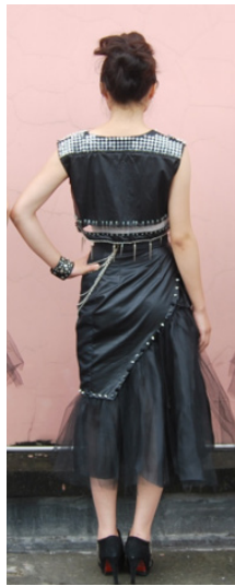
图 4 款式二背面