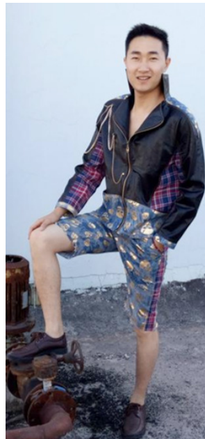
图 9 款式五正面