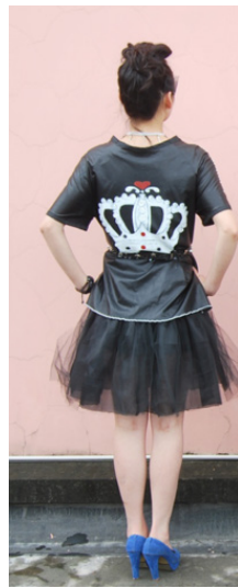
图 6 款式三背面

款式四：上身使用墨黑漆皮面料，后过肩为折线分割，且过肩以平头铆钉做局部装饰，袖子做流苏的无袖结构。领子为半翻领，金属拉链从领缝至门襟处。衣摆为不对称式，右短片下摆用金属链条做装饰，背部贴骷髅图案。下身为长裤以漆皮面料为主，侧片分割以红色格子面料拼接增加造型（如图 7、图 8）。