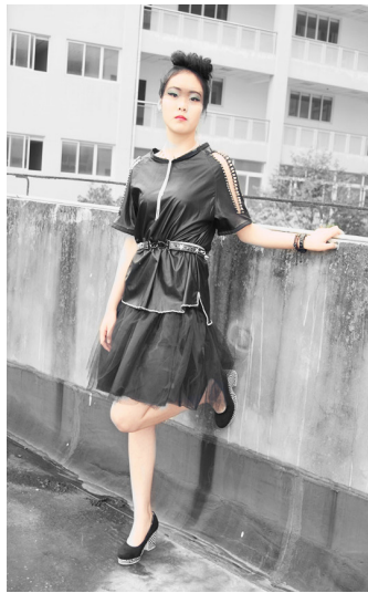
图 5 款式三正面