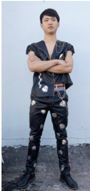
图 7 款式四正面

款式六：上身使用墨黑漆皮面料，结构采用旋转的衣领，呈现螺旋造型，袖子为短袖，袖口加有流苏，肩部与袖子以牛仔与皮制面料拼接而成，金属拉链与金属铆钉装饰在领面、门襟处，下摆使用红蓝格子弧线分割与拼接。背部破缝处理并装饰金属拉链。裤子使用皮革面料为主，背面制作贴袋。在脚口处有斜线红蓝格子分割拼接。金色骷髅图案以散点形式贴在上装与下裤中（如图 11、图 12）。