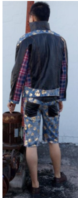
图 10 款式五背面