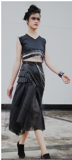
图 3 款式二正面