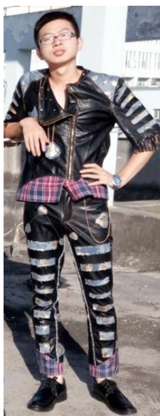
图 11 款式六正面