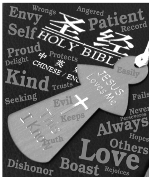
图 3 (KJV 版本)