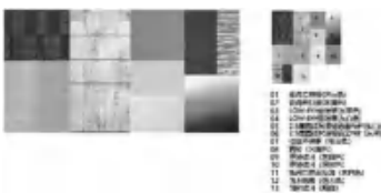
图 6 材料样板

光设计考虑将音频强弱变化的节奏线条作为设计意向,夜幕中动感的灯光变化恰好从远距离空间中传递酒店的音乐主题属性。(见图 7)