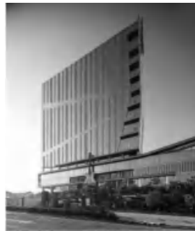
图 3 沿街透视

键,突出建筑的秩序感(见图 5)。塔楼立面幕墙窗框的线条用隐框斜线打断,使得立面造型灵活跳跃。竖向线条的错落起伏,同时形成音律强弱的节奏感。所有造型手法都充分体现渴望自由的摇滚精神内核,使建筑真正成为凝固的音乐。