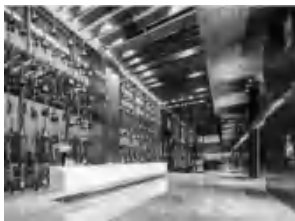
图 2 大堂室内

酒店客人流线的空间序列一般可以简单概括为到达—接待门厅—大堂—客房及其他功能(全日餐厅、宴会厅、休闲娱乐等)。由于用地过于狭窄,酒店到达区在设计中充分利用塔楼下部的架空空间,结合入口倾斜的巨型玻璃立面,压低访客空间感受,再进入 12m 高的挑空欢迎厅,放大空间,营造欲扬先抑的空间效果。接待门厅也并不像传统酒店作为缓冲空间,而是极具创造性地布置哈雷摩托、Hard Rock Shop 成为炫目的展示和售卖厅,让客人瞬间就进入主题感、视觉冲击力强烈的摇滚世界。大堂布置在 5F,电梯打开的一瞬间,10m 通高的大堂,无论是视野高度,室外景观还是 Fender 红色吉他组成的整面装饰墙,都带来摇滚主题的二次震撼(见图 2)。在通往客房及其他功能的过渡空间中,遍布音乐藏品展示空间,展品全部收集自当红摇滚明星。同时,应酒店品牌要求,布置摇滚舞台及录音室等专业性功能空间,进一步体现酒店主题的专业性。游泳池在设计初期就放弃了布局在室内,而是大胆置于屋顶,结合舞台音乐酒吧定期举办泳池派对,彰显摇滚的独特魅力。一系列空间序列及功能流线组织中,从入口,门厅,大堂到附属空间到酒店屋顶,都充分利用建筑尺度和流线序列的组织,展示音乐主题,加入感官体验,放大主题效应 [3] 。