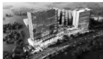
图 1 鸟瞰效果图

高尔夫球场附近,酒店所在的 C2 地块是个东西向十分狭长的地块,设计功能兼具酒店、办公和商业展示 3 部分。总用地面积 16775.18m 2 ,容积率 3.67。酒店与办公功能分为两个塔楼居于地块东西两端,下部贯穿商业及展厅(见图 1)。酒店客房规模共计 258 间,包括 51 间套房,其中还有录音套房和巨星套房。酒店的其他功能配置与传统酒店并无太大区别,对于此类主题酒店,可以从以下 3 个原则入手进行设计思考。