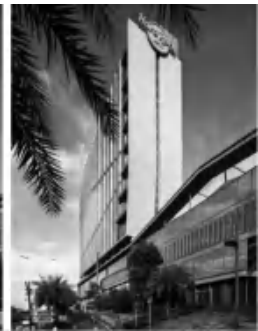
图 4 沿街透视