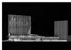
图 7 灯光设计